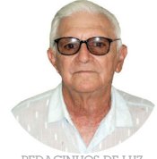
PEDACINHOS DE LUZ HELDER F. SIMUJRO

Para o Amor florescer à luz da nossa presença, tem que ser forte bastante para que nada nos torne fracos no modo de julgar, pensar e realizar desejos, que não contribuem para um relacionamento, onde exista um amor verdadeiro.