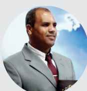
Pr. Anastácio Martins

membro da Academia Rio-Grandense de Letras, é arquiteto, empresário e escritor e titular do site www.puggina.org, colunista de Zero Hora e de dezenas de jornais e sites no país. Autor de Crônicas contra o totalitarismo; Cuba, a tragédia da utopia; Pombas e Gavieiros. A tomada do Brasil, integrante do grupo Pensar+.