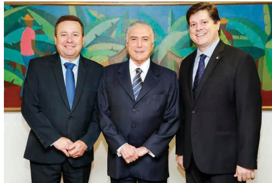
Deputado estadual Léo Oliveira, Presidente da República Michel Temer e o deputado federal Baleia Rossi. (07/11/2016)

As obras de internacionalização do aeroporto Leite Lopes voltam a ser prioridade do Governo Federal! Em Brasília, os deputados Léo Oliveira e Baleia Rossi, o prefeito