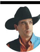
Versos de Rodeio tirado do livro "Bala de Prata & Amigos - Trovas de Rodeio"

Quero fazer você flutuar. Te dar um beijo na boca... E fazê-lá arrepiar, Ouvir você dizer!!! Que sou o homem... Que faz você suspirar! Ooo vichii, vichii, vichee!!!