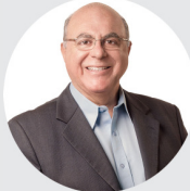
Arnaldo Jardim é Secretário de Agricultura e Abastecimento do Estado de São Paulo

Estão sendo diplomados os novos prefeitos e as novas prefeitas, vereadores e vereadoras. Foram eleitos em um momento de alta tensão política, em meio à crise econômica. Enfrentaram um eleitor criterioso, desconfiado e exigente. E isso é muito bom para o futuro do Brasil. Afinal de contas, é de uma população mais informada e participativa que nós precisa-