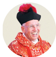
Monsenhor Jonas Abib

Seus problemas e seus pecados não determinam quem você é