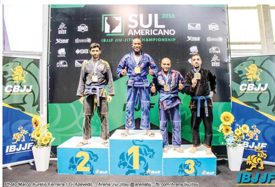
Azavedo - Arena Jiu-Jitsu @arenabjj / fb.com/ArenaJiuJitsu