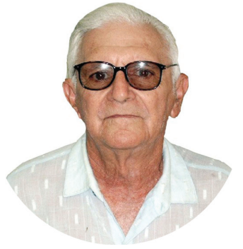
PEDACINHOS DE LUZ HELDER F. SIMURRO

Estes são todos exemplos de uma nova agricultura. Pujante, dinâmica, tecnológica, produtiva e amiga da natureza