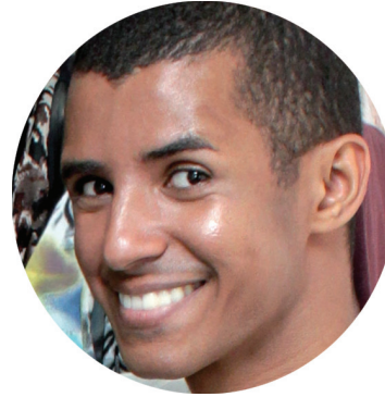
Up! - Por Cícinho Maquiador, Designer de Moda, Scouter

Empresa Jornalística Scandela & Scandela Ltda - ME Inscrita no CNPJ sob o nº 07.146.355/0001-32 Inscrição Municipal nº 109.562 Diretor: Gustavo Roberto T. Scandela - MTB nº 33.849 Jornalista: José Roberto Scandela - MTB nº 33.487 Redação, Administração e Departamento Comercial: Avenida General Osório nº 218 - Jaboticabal/SP - CEP: 14870-100 CPT e Impressão: 1ª Página - São Carlos /SP - Interpress Comunicações Editoriais Ltda. - CNPJ 60.394.848/0001-74 - Av. São Carlos nº 1799 - Tel.: (16) 3373.7373 - Departamento Comercial GIAN Representante em São Paulo: RGD Comunicação S/C Ltda. Rua Duarte de Azevedo, 532 - Bairro Santana - CEP 02036-022 - Tel.: (16) 2971.1000 Fones: (16) 3202.2636 Email: contato@jornalagazetajaboticabal.com.br Editoração Eletrônica - Impressão em Off-Set - Fotolito