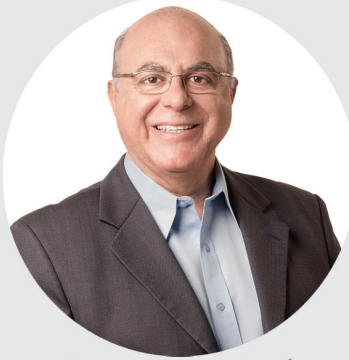
Arnaldo Jardim é Secretário de Agricultura e Abastecimento do Estado de São Paulo

Comemoramos dia 2 de julho o Dia Internacional do Cooperativismo, um sistema de produção econômica não apenas justo e eficaz, mas também distributivista.