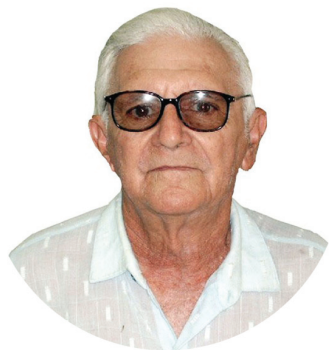
PEDACINHOS DE LUZ HELDER F. SIMURRO

Isso na prática inviabilizará o processo de financiamento via cooperativas ao nosso produtor rural, causando um dano irreparável à nossa produção. Por isso exigimos uma imediata revisão destas normas, feitas certamente sem o conhecimento da realidade virtuosa que é o papel das cooperativas agrícolas no fornecimento de crédito, na produção agropecuária de São Paulo e do Brasil.