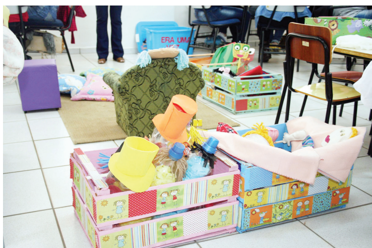
Dando sequência ao trabalho de aprimoramento e capacitação dos professores da rede

municipal de ensino, a secretaria de Educação, de Jaboticabal, desenvolveu no sábado (1º) mais uma oficina, em parceria com a Faculdade São Luís e a entidade Olhos da Alma.