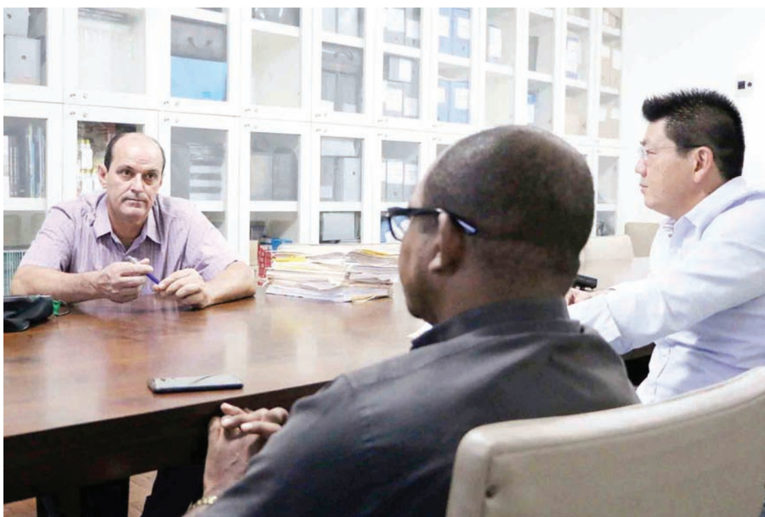
Membros da Comissão de Finanças e Orçamento durante reunião para analisar as contas do prefeito Raul Gírio referentes a 2015.

Entre os apontamentos feitos pela Corte de Contas do estado e pelo Ministério Público de