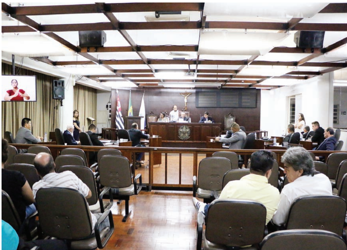
Vereadores durante a Ordem do Dia.