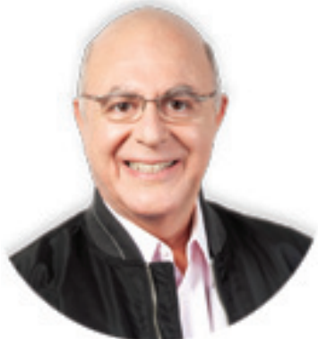
Arnaldo Jardim Deputado Federal PPS/SP

Av. Douglas Fogaça de Aguiar, 32 - Conj. Hab. Ulisses Guimarães - Jaboaticabal/SP