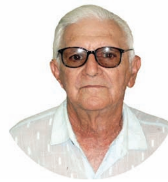
PEDACINHOS DE LUZ HELDER F. SIMURRO

* Percival Puggina (74), membro da Academia Rio-Grandense de Letras, é arquiteto, empresário e escritor e titular do site www.puggina.org , colunista de dezenas de jornais e sites no país. Autor de Crônicas contra o totalitarismo; Cuba, a tragédia da utopia; Pombas e Gaviões; A Tomada do Brasil. Integrante do grupo Pensar+.