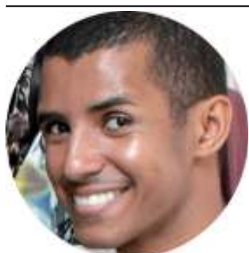
Up! - Por Cicinho Maquiador, Designer de Moda, Scouter

Diante do que estamos vivendo, a atitude para proteger a si mesmo e os outros, colocou muita gente em isolamento social. Se esse é seu caso, saiba que encontrar pequenas formas de distração e prazer no dia a dia pode ajudar no bem-estar. E continuar cuidando da sua beleza pode