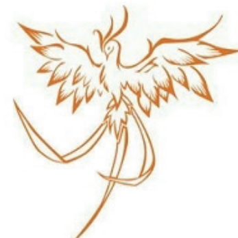
Luz, Amor e Gratidão