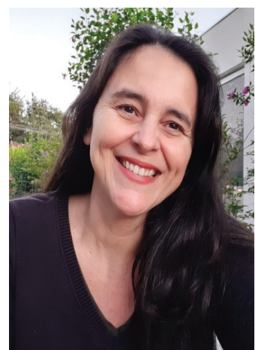
Por Sônia Monteiro Pavanelli

Para o corpo docente do Colégio Objetivo, experiências como essa são fundamentais. Além de estimular a curiosidade científica e tecnológica, a visita trabalha a oralidade e mostra a importância da responsabilidade na transmissão de informações para o público.