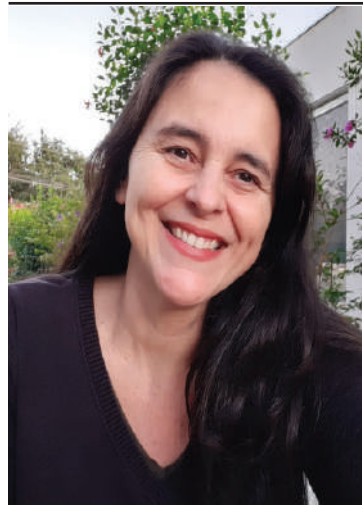
Por Sônia Monteiro Pavanelli

Equipe Libras Para Todos de Jaboticabal e Região